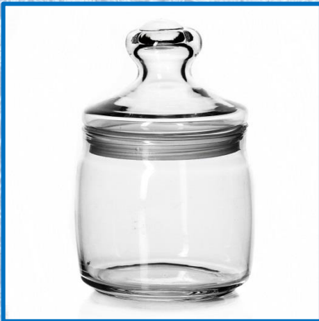
Стеклянная банка 0,5 литра