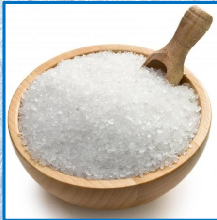
Соль – 18 чайных ложек